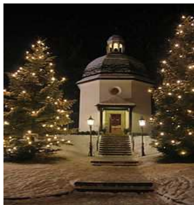
Kaplnka Tichej noci v Oberndorfe

Napísal ju Joseph Mohr už roku 1816 vo farnosti Mariapfarr (Mariapfarr je obec v Rakúsku v spolkovej krajine Salzburgsko v okrese Tamsweg). Gruber skomponoval pred Vianocami 1818 k jeho básni melódiu. Pieseň sa okamžite stala veľmi populárnou. Dnes je preložená do 300 jazykov a nárečí. Stille-Nacht-Kapelle ( Kaplnka Tichej noci ) v Oberndorfe, kde pieseň zaznela po prvýkrát, je dnes turistickou atrakciou.